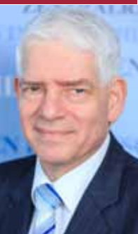
Др. Йозеф Шустер

Квод хараббаним – уважаемые раввины, уважаемые читательницы и читатели,