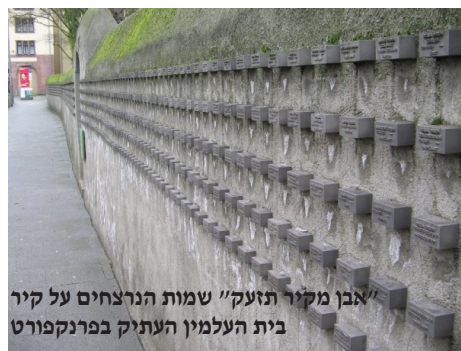
"אבן מקיר תזעק" שמות הנרצחים על קיר בית העלמין העתיק בפרנקפורט

שניסיונות ההטמעות יהיו גדולים יותר, כך יוקעו נושאי הגנים היהודיים מסביבתם. כמו אז, גם היום אנו יכולים לטעות ולהאמין שמדובר בתור הזהב של יהדות גרמניה, בכל מקרה למה שקשור באיכות חיים וליחס השלטונות ליהודים. למעלה ממיליון וחצי מוסלמים חיים בגרמניה, אולם היחס שהם מקבלים אינו משתווה ליחס אשר לו זוכים היהודים במדינה. חברי הקהילות השונות ברחבי גרמניה משלמים מס חבר לקהילה. דמי המס, משולמים ע"י המעביד מסך הברוטו. יצוין כי דמי החבר, המועברים לקהילות היהודיות, ע"י החברים, מקנים עבורם את הזכות ליהנות משרותי הקהילה כגון: שירותים סוציאליים, הנחה במוסדות החינוך, התחייבות למקום בבית הקברות המקומי והשתתפות פעילה במגוון התוכניות והפעילויות הנערכות ע"י הקהילה. כיום. הקהילה היהודית, בניגוד לאחרות, זוכה להכרה כאיגוד המעוגן בחוק וכמו הכנסייה הפרוטסטנטית או המוסדות הקתוליים, יש לה זכות להיות מיוצגת במגוון רחב של מוסדות ציבוריים.