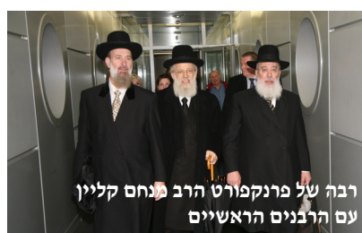
הרב עמאר בעת הביקור בביה"ס המקומי