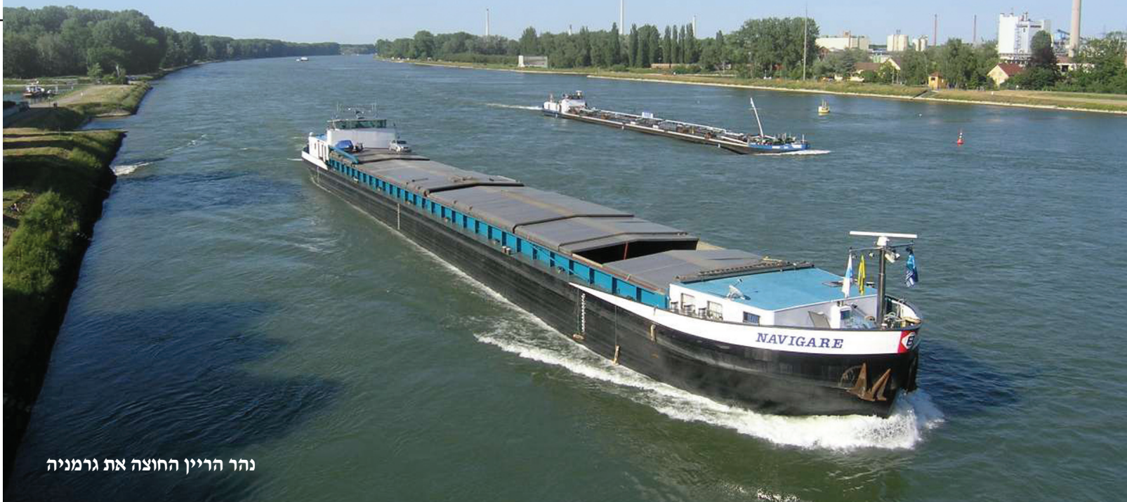
נהר הריין החוצה את גרמניה

מדינת ישראל, בשונה משאר מדינות המערב, מתקשה להתחרות בסל הקליטה הגרמני. הסל הנדיב של הגרמנים, מציע למהגרים, מקום מגורים מסודר, קצבת מחיה חודשית, ביטוח רפואי, דמי אבטלה, ושירותי רווחה נוספים. בתנאים שכאלה, לא פלא שרבים מהישראלים, מבקשים אף הם להעתיק את מקום מגוריהם לגרמניה. אחרי הכל, תודו שעדיף לשבת בבית