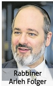
Rabbiner Arie Folger

dereinweihung des Bejt ha-Mikdásch publik machen. Der heidnische Götzendienst, den Antiochus Epiphanes eingeführt hatte, wurde abgeschafft: Alle Götzenbilder und alle Gegenstände, die zu ihrer Verehrung dienten, wurden zerstört, und diejenigen, die das Verbrechen der Entweihung des Bejt ha-Mikdásch begangen hatten, wurden aus Jerusalem und schliesslich auch aus den anderen jüdischen Städten in Israel vertrieben. Das Wunder, dass man ein kleines Fläschchen Öl fand, das noch tahór 2 war und die Menorá im Tempel acht Tage brennen liess, kann man als G"ttes Zustimmung zur Wiedereinweihung unseres heiligsten Ortes verstehen.