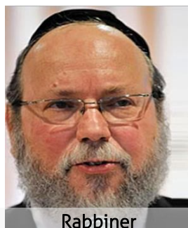
Rabbiner Rafael Evers

verstand, dass es eines Tages so kommen würde, wie wir auch in "Al hanissim" an Chanukka sagen: "Du hast die Starken in die Hände der Schwachen gegeben, viele in die Hän-